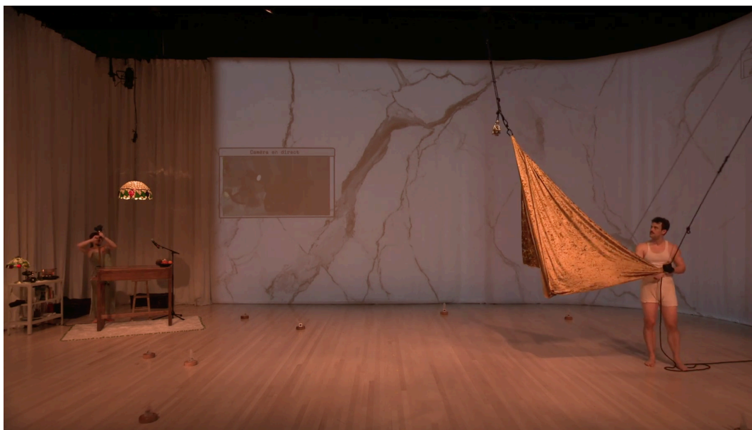
Extraits photographiques - Diffusion à Tangente - du 13 au 21 février 2021